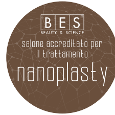
NANOPLASTY ABLAKMATRICA 15 cm x 15 cm