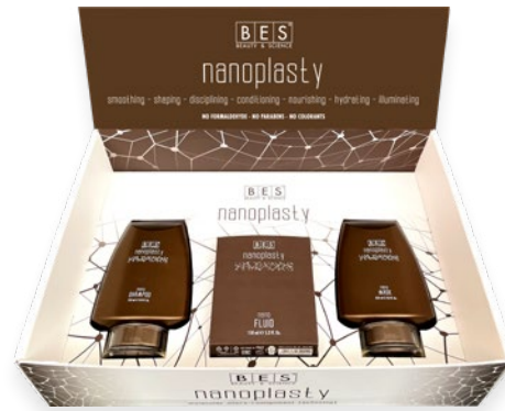
NANOPLASTY DISPLAY BOX TERMÉKEKEL 36 cm x 25 cm x 9 cm NANO SAMPON 250 ml - NANO FLUID 150 ml - NANO PAKOLÓ 250 ml