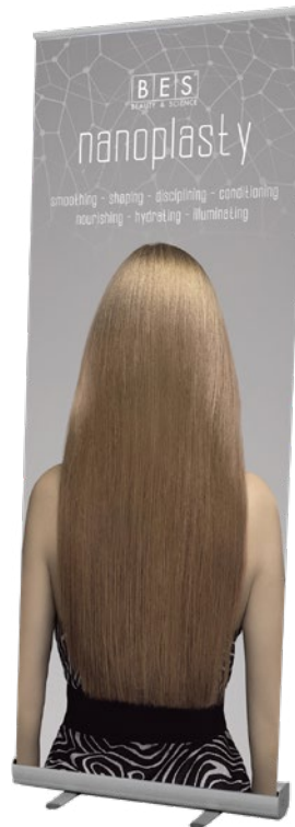
NANOPLASTY ROLL-UP 80 cm x 200 cm