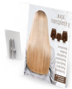
NANOPLASTY ASZTALI DISPLAY 21 cm x 9 cm x 30 cm (magasság)

BES HUNGARY KFT. www.besh.hu info@besh.hu