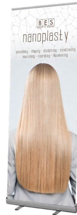
NANOPLASTY ROLL-UP 80 cm x 200 cm