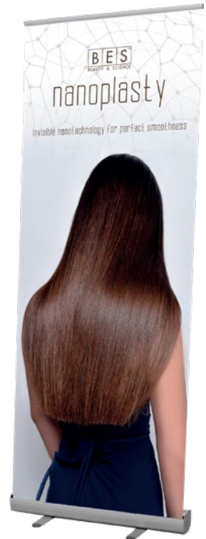
NANOPLASTY ROLL-UP 80 cm x 200 cm