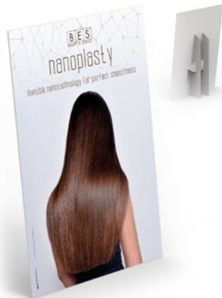
NANOPLASTY PADLÓDISPLAY 70 cm x 35 cm x 100 cm (magasság)