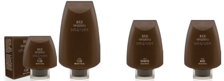
NANO FLUID 150 ml