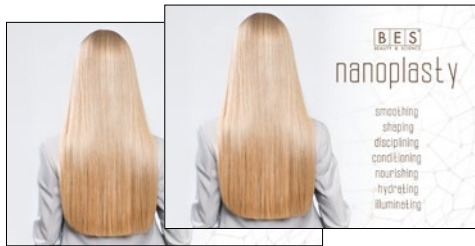
NANOPLASTY SZALONMAPPA 30 cm x h 21 cm