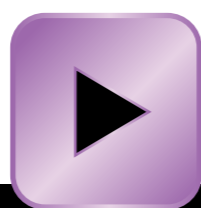
KLT ÚTMUTATÓ 3